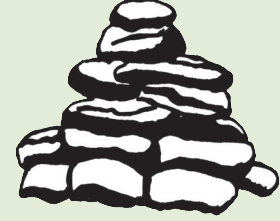
429 kg Rohstoffe

2.7kg ağırlığındaki diz üstü bilgisayarın yapımı sırasında, 429kg hammaddeye ihtiyaç duyulmaktadır.