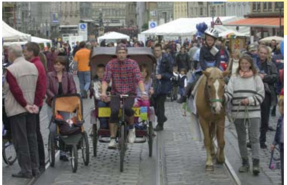
In Augsburg bewegt sich was! Die Stadt und ihre Bürger sind auf dem Weg in Richtung Nachhaltigkeit – wie hier beim Aktionstag „Mobil in die Stadt“.

KUMAS fördert jährlich bis zu vier Leitprojekte in Bereichen wie „Umweltökonomie“, „Existenzgründung“ oder „Erneuerbare Energien“. Zu den Hauptaktivitäten des Vereins zählen jedoch Vermittlung und Öffentlichkeitsarbeit. Dabei wächst das Netzwerk immer weiter über die Region hinaus. Auf internationalen Messen und Kongressen werden längst weltweite Kontakte geknüpft. So sind zum Beispiel Delegationen aus Asien keine Seltenheit auf der Augsburger Umweltmeile. KUMAS ist auf dem besten Wege, sich zu einem der führenden Umweltzentren in Europa zu entwickeln.