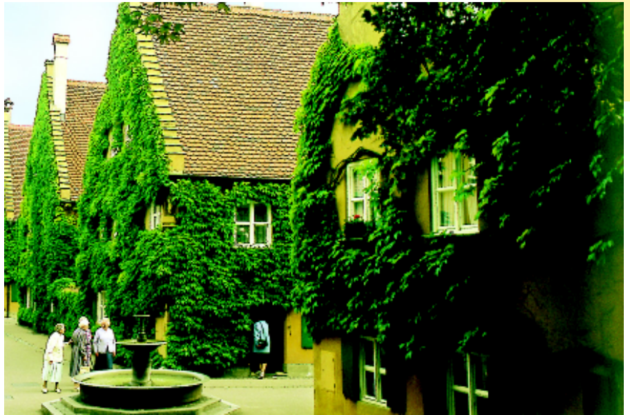
Sozialer Wohnungsbau mit Tradition: In der Fuggerei gibt es auch heute noch sehr günstige und schöne Wohnungen – und das mitten in der Innenstadt.