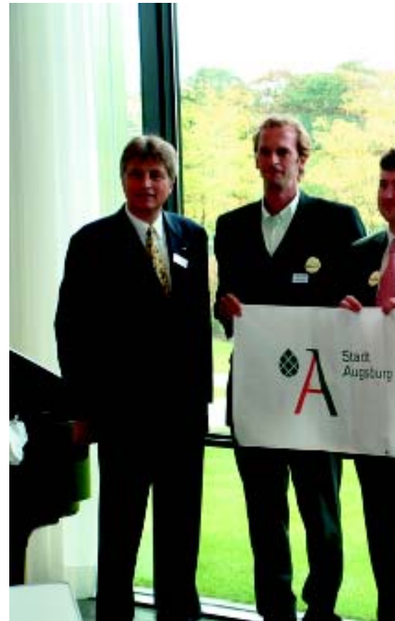
Preisverleihung der Deutschen Umwelthilfe an die Stadt Augsburg im September 2003 in Berlin.

Die Lokale Agenda 21 will die Frage beantworten helfen, wie sich eine Kommune in den kommenden Jahrzehnten weiterentwickeln soll. Die dazu notwendigen Veränderungen sollen vor Ort in Zusammenarbeit mit den gesellschaftlichen Kräften sowie mit den Bürgern geplant und in Gang gesetzt werden. Ziel der Lokalen Agenda 21 ist es, das Zusammenleben (sozialer Aspekt), Arbeit und Verdienst (wirtschaftlicher Aspekt) und den Umgang mit Natur und Umwelt sowie mit der Gesundheit der Menschen (ökologischer Aspekt) dauerhaft, zukunftsfähig bzw. nachhaltig zu verbessern. Die Folgen unseres Handelns für Mensch und Natur in ärmeren Ländern sowie für das Leben unserer Kinder und Enkel nehmen dabei einen hohen Stellenwert ein.