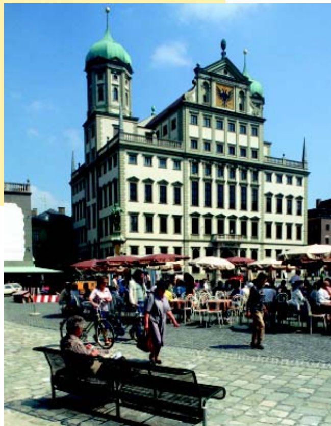
Eine Stadt mit hoher Lebensqualität: Vor dem Rathaus und an vielen anderen Plätzen verweilt man gerne.

gute Angebot an öffentlichen Verkehrsmitteln. An Werktagen fahren tagsüber sämtliche Straßenbahnen im fünfminütigen Takt. So kommt man bequem - ohne Stau und Parkplatzsuche - in die Innenstadt und wieder heraus. Der „Nachtbus“ bringt Nachtschwärmer am Wochenende ab Mitternacht sicher nach Hause. Die Fahrten sind stündlich und kosten nur 2,00 bzw.