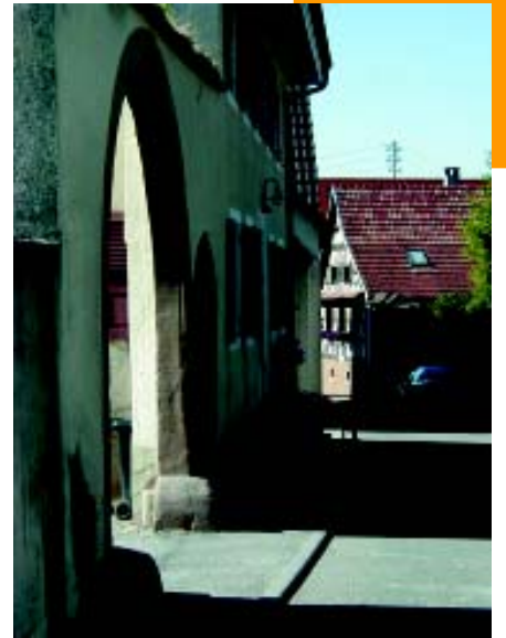
Typisch für das Oberdorf: „Schwiboge“ (Rundbögen) und enge Straßen.

Im Rahmen des Dorfentwicklungskonzepts fördert das Ministerium für Ernährung und Ländlicher Raum von Baden-Württemberg derzeit die Umgestaltung des Eichstetter Bahnhofsbereichs. Das Kernstück der Maßnahme ist ein moderner Informations- und Veranstaltungspavillon, der neben dem Bahnhof anstelle eines baufälligen Schuppens errichtet wird. Der gläserne Pavillon soll als „Schaufenster“ der Gemeinde Eichstetten dienen. Zukünftig können sich hier Besucher und Einheimische über das Dorf informieren.