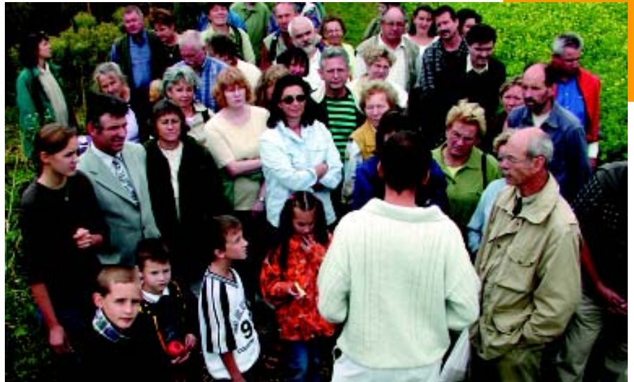
Der Erhaltungs- und Zuchtgarten der Stiftung „Kaiserstühler Garten“ zieht viele Besucher an.

Die Sorten sind den südbadischen Klima- und Bodenbedingungen optimal angepasst – und sind deshalb resistenter gegen Schädlingsbefall. Mit dem Verkauf der Samen haben sich Landwirte eine neue Einkommensquelle geschaffen. Außerdem ist der Erhaltungs- und Zuchtgarten ein Anziehungspunkt für Besucher. Als Teil des „Eichstetter Natur- und Kulturlehrpfades“ trägt er zur Umweltbildung bei. Angegliedert ist auch die „Ländliche Akademie“ der Stiftung „Kaiserstühler Garten“. Sie bietet Kurse für Kindergärten, Schulen, Hochschulen, Landwirte sowie für die breite Öffentlichkeit an.