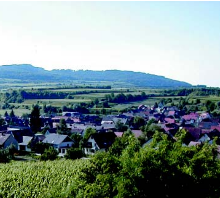
Umgeben von Weinbergen: Das Dorf Eichstetten.