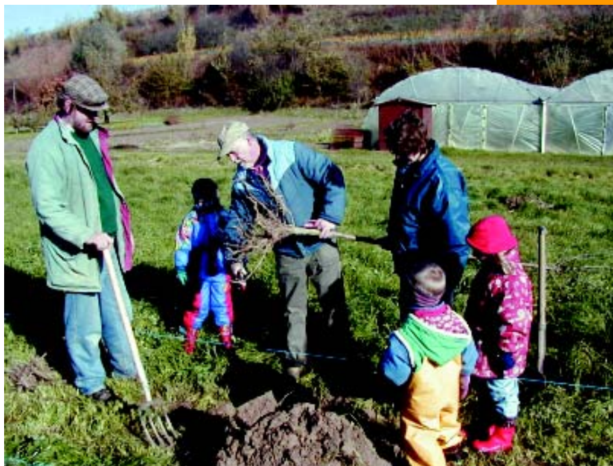
Die Eichstetter planen nicht nur, sondern legen auch selbst Hand an – schon die ganz Kleinen helfen mit!

Hierzu gibt es genügend Ideen, die bis 2006 realisiert werden sollen. Unter anderem will der Arbeitskreis öffentliche Räume verschönern. Wo es möglich ist, wird entsiegelt, gepflastert und begrünt. In offenen Gerinnen abfließendes Oberflächenwasser wird bewusst als Gestaltungselement eingesetzt. Sitzgelegenheiten und Spielmöglichkeiten für Kinder lassen neue soziale Treffpunkte entstehen. Ein touristisch interessanter Rundweg wird durch die Gassen führen, der dem Fußgänger Einblicke in Innenhöfe und Ausblicke auf die umgebende Landschaft des Kaiserstuhls bietet. Ein weiterer Ansatzpunkt sind 20 bis 30 leerstehende Gebäude, hier soll neuer Wohnraum entstehen. Dadurch muss die Gemeinde kein weiteres Bauland am Ortsrand ausweisen.