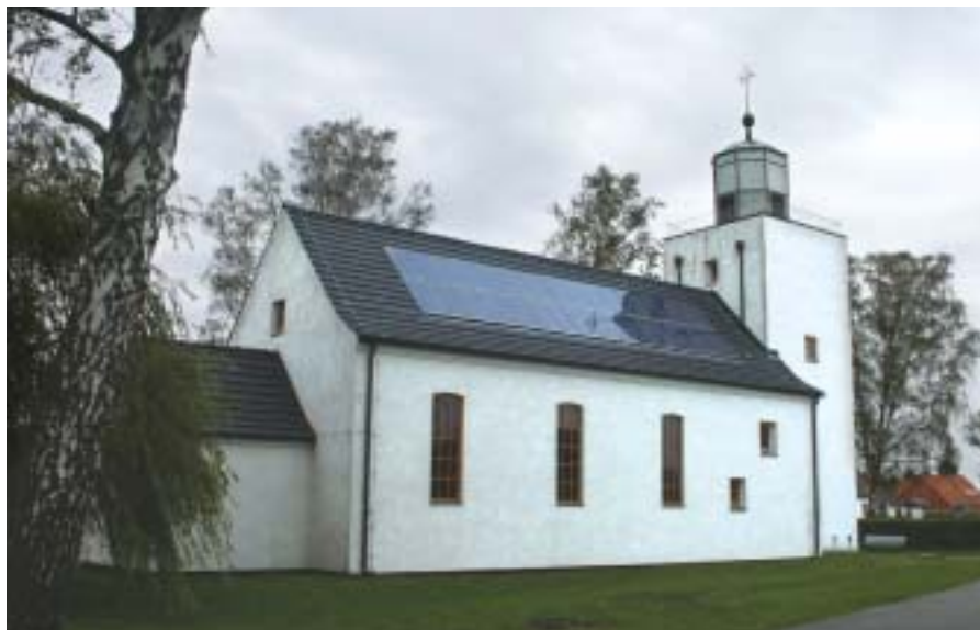
Eine sinnvolle Verbindung von Alt und Neu: Die „Solarkirche“ Sankt Petri in Mönkebude liefert klimafreundlichen Strom.

Die Gewerbebetriebe sind gleichmäßig über das Dorf verteilt. Es gibt also keine reinen Gewerbegebiete wie andernorts. Im Flächennutzungsplan der Gemeinde sind auch in Zukunft Mischgebiete vorgesehen, in denen sich kleinere Betriebe ansiedeln können. So bleibt der Charakter des Dorfes erhalten. Gewerbeansiedlungen im großen Stil kommen ebenso wenig in Frage wie der Bau von Ferienkolonien – so ist es im Leitbild der Ortsentwicklung festgelegt. Damit es nicht nur um das Dorf herum grün ist, gibt es seit 2003 eine besondere Bürgerpflicht: Alle, die heiraten oder ein Haus bauen, müssen einen Baum pflanzen. Die Mönkebuder erfüllen diese Pflicht gern.