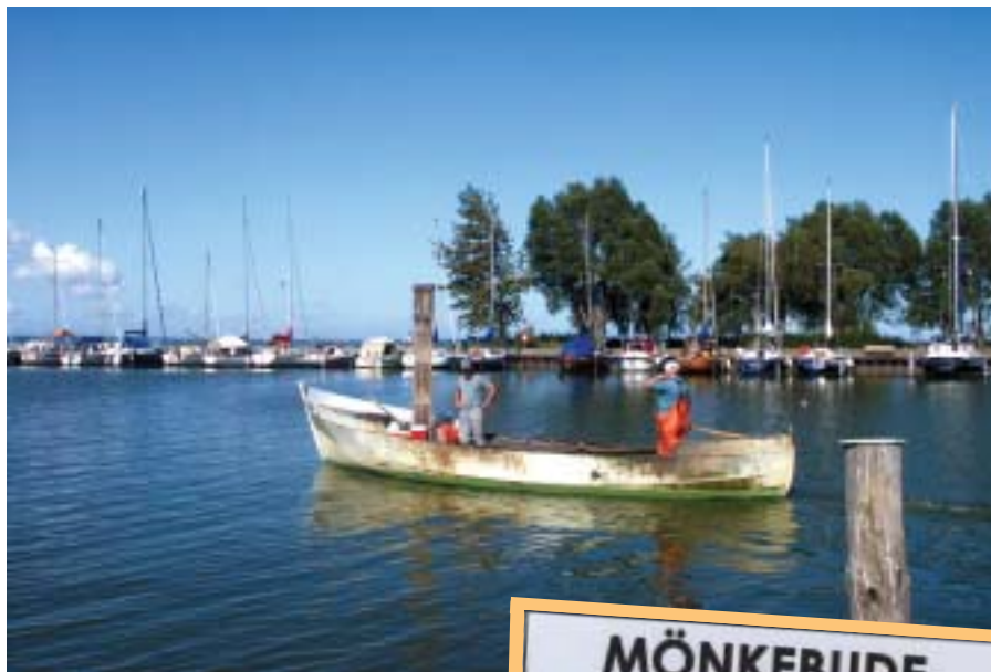
Mit der Lokalen Agenda 21 steuert Mönkebude in Richtung Nachhaltigkeit.

Durch die geplante Personenfähre zwischen Mönkebude und Stettin soll die Verkehrsverbindung zwischen Deutschland und Polen verbessert werden. Der dafür notwendige Molenausbau im Mönkebuder Hafen ist ein geringer Aufwand im Vergleich zu einem Straßenausbau. Die Gemeinde ist außerdem Mitglied der grenzüberschreitenden „Regionalen Agenda 21 Stettiner Haff“ und engagiert sich für den entstehenden „Naturpark Stettiner Haff“.